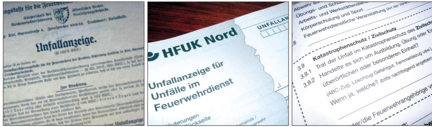
Was die alles wissen wollen! Jetzt auch noch Fragen zum Katastrophenschutz?