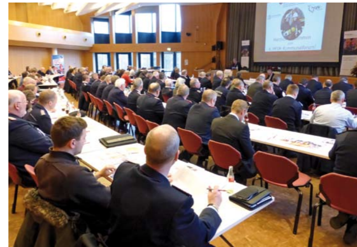
Rund 180 Führungskräfte der Städte, Gemeinden und Feuerwehren besuchten das 4. HFUK-Kommunalforum.

Die Hanseatische Feuerwehr-Unfallkasse Nord hatte zu ihrem 4. Kommunalforum eingeladen: Rund 180 Mitarbeiter der Städte und Gemeinden sowie Führungskräfte der Feuerwehren besuchten die Fachtagung, um gemeinsam wichtige Themen zur sozialen Absicherung und zur Prävention von Unfällen in der Freiwilligen Feuerwehr zu diskutieren. Unter dem Leitmotiv „FEUERWEHR: Ehrenamt braucht Sicherheit“ war das Themenfeld breit abgesteckt.